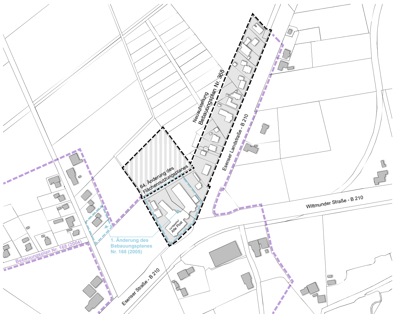
Abb. 1: Übersichtsplan Bauleitplanung

Wesentlicher Bestandteil des Plangebietes des Bebauungsplanes Nr. 368 ist der traditionsreiche Landgasthof „Alte Post“, ein privat geführtes Hotel mit 4-Sterne Ausstattung. Die Rahmenbedingungen für Betriebe des Beherbergungsgewerbes haben sich in den letzten Jahren in Ostfriesland deutlich verändert. Neben stetig steigenden Übernachtungszahlen werden auch zunehmend Angebote für den mobilen Tourismus (Wohnmobilstandplätze mit angeschlossener Gastronomie), Tagungsveranstaltungen und Wellnessangebote nachgefragt. Gastronomische Betriebe wie der Landgasthof „Alte Post“ finden sich insoweit in einem verschärften Anforderungsfeld wieder. Die bestehende Bauleitplanung in Ogenbargen wird dieser Entwicklung heute nicht mehr gerecht, da insbesondere Flächen für die bauliche Erweiterung und Umstrukturierung des Betriebes fehlen.