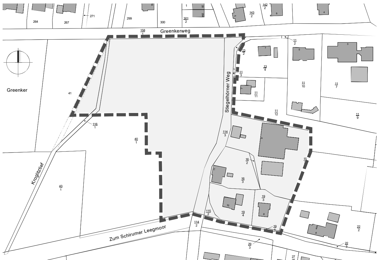
Abb. 1: Übersichtskarte Geltungsbereich Bebauungsplan Nr. 349

Der Ortsteil Schirum besteht aus den drei Ortschaften Schirum, Schirumer Leegmoor und Sandhöchte sowie der Splittersiedlung Bengenkamsweg. Den Siedlungsschwerpunkt des Ortsteils bildet der Hauptort Schirum. Das Plangebiet liegt im Hauptort Schirum und umfasst eine Fläche von 2,04 ha. Der Geltungsbereich schließt unmittelbar südlich an die bebauten Bereiche am Greenkerweg an und westlich an die bebauten Bereiche am Stiegelhörnerweg; südöstlich am Stiegelhörnerweg sind darüber hinaus auch bebauten Bereiche in den Geltungsbereich des Bebauungsplanes einbezogen. Begrenzt werden die neuen Bauflächen des Geltungsbereiches nördlich durch den Greenkerweg, östlich durch den Stiegelhörnerweg, südlich durch die Kreisstraße „Zum Schirumer Leegmoor“ und westlich durch das Kroglitztief sowie anliegende landwirtschaftliche Nutzflächen. Der Geltungsbereich ist in der Planunterlage selbst durch Planzeichen dargestellt.