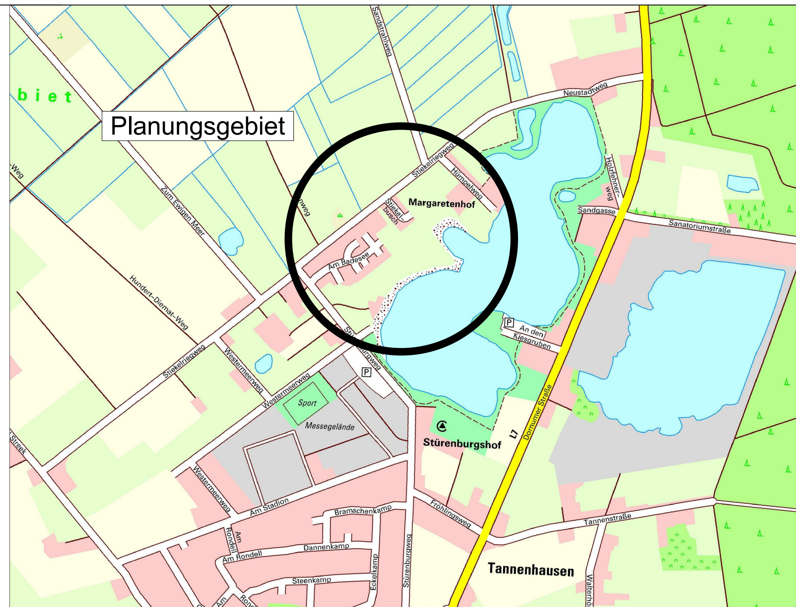
Übersichtskarte Erholungsgebiet Tannenhäuser Maßstab 1 : 10000

Sind Straßenteile, Straßenzüge und Wohnwege mit den Sammelfahrzeugen nicht befahrbar oder können Grundstücke nur mit unverhältnismäßigem Aufwand angefahren werden, haben die zur Entsorgung Verpflichteten gemäß § 18 Abs. 2 Satz 4 der Satzung über die Abfallentsorgung für den Landkreis Aurich (Abfallentsorgungssatzung) vom 20.03.2001 (Amtsblatt des Landkreises Aurich Nr. 13 vom 31.03.2001) die Abfallbehälter an eine durch die Entsorgungsfahrzeuge erreichbare Stelle zu bringen oder bringen zu lassen. In diesem Fall kann durch den Landkreis Aurich als öffentlich-rechtlichem Abfallentsorgungsträger ein geeigneter Stand- und Aufstellplatz bestimmt werden, der durch die Entsorgungsfahrzeuge erreicht werden kann. Die Anwohner von Stichstraßen ohne Wendeanlage müssen ihre Abfall- und Wertstoffe an den Einmündungen der Stichstraßen in die nächstgelegene Gemeindestraße zur Entsorgung bereitstellen. Entsorgungsfahrzeuge dürfen aus Sicherheitsgründen in Stichstraßen ohne Wendeanlage nicht wenden.