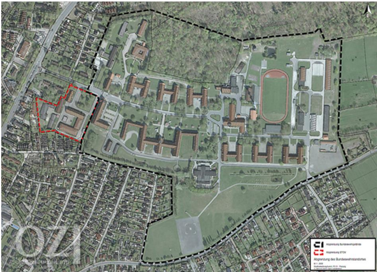
Abbildung 2: Kasernengelände im Luftbild

Die vorliegende Bewertung fließt in die Planung der Folgenutzung mit ein.