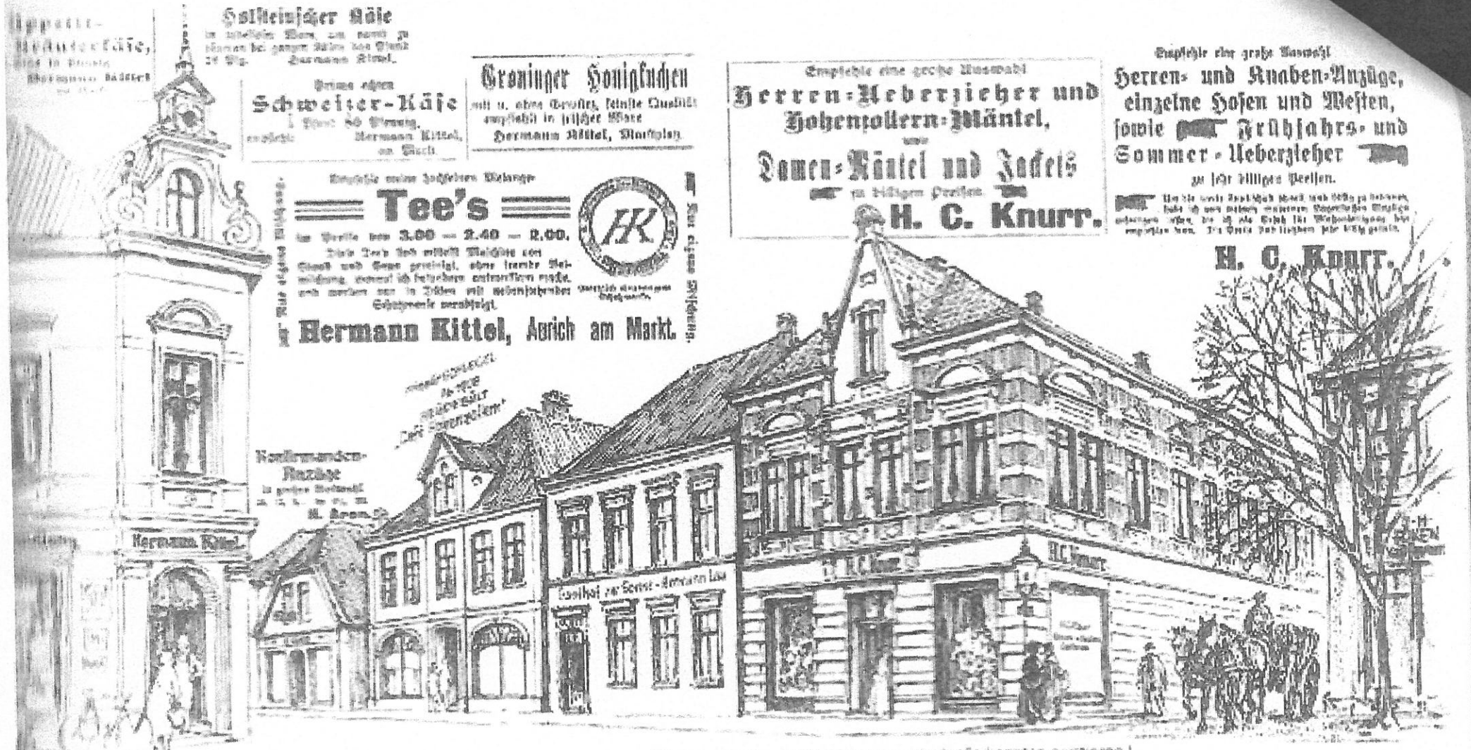
„Plünnenrieter“ - viel Konkurrenz - doch alle konnten existieren!