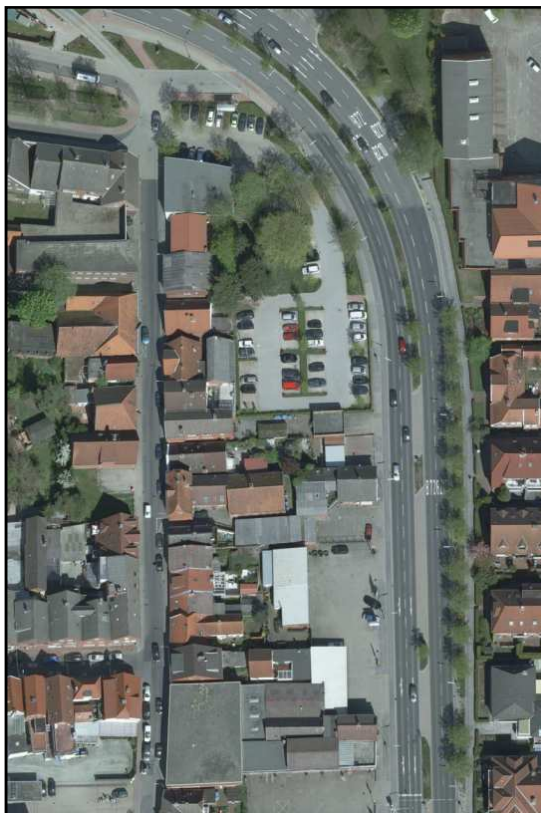
Abbildung 2: Luftbild

Aus der Plangrundlage und dem Luftbild geht der hohe Versiegelungsanteil durch Haupt- und Nebengebäude sowie Parkplatzfläche und Wege hervor. Die verbleibenden unversiegelten Restflächen sind neben den vorhandenen Bäumen (s. Baumkataster) mit Ziersträuchern und sonstigen Abstandsgrün bewachsen.