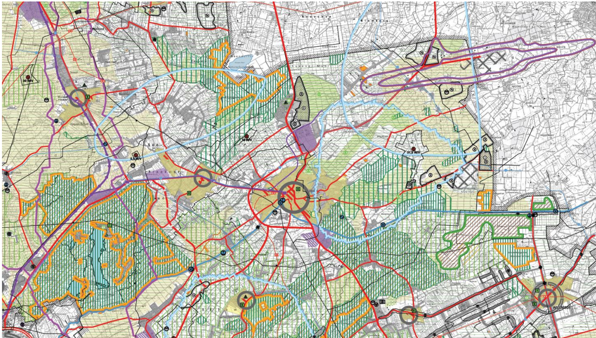
Abbildung 2: Auszug aus dem Entwurf des RROP 2015 des Landkreises Aurich