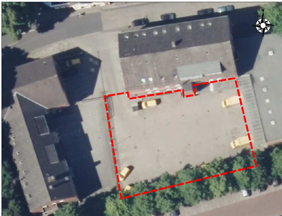
Abb. 1: Postfiliale Aurich Burgstraße 55 (Untersuchungsgelände rot markiert)

Die Postfiliale Aurich befindet sich westlich der Innenstadt von Aurich an der Burgstraße 55 (Gemarkung Aurich, Flur 11, Flurstück 1/6). Das Untersuchungsgelände ist der Innenhof der Postfiliale.